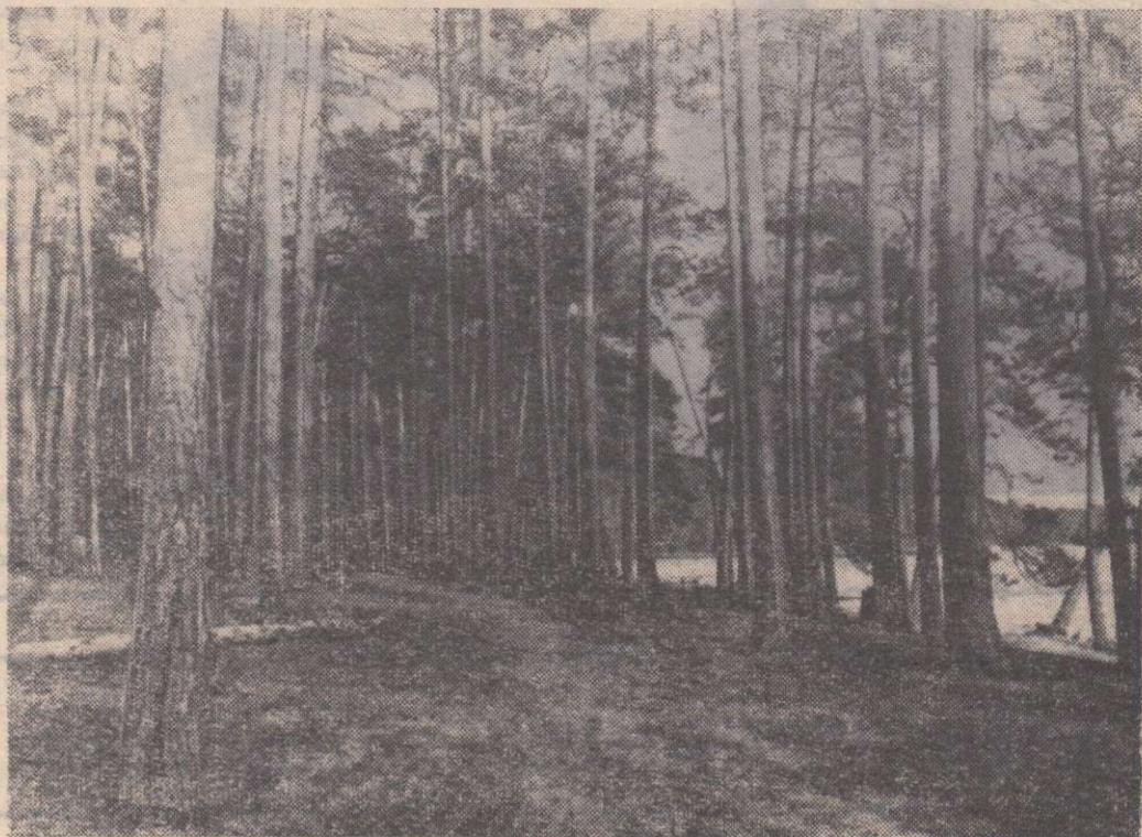
ЛЕС ДРЕМУЧИЙ СТОИТ

— Теперь я знаю, кто вы. Но кто же этот мсье... Дюма?